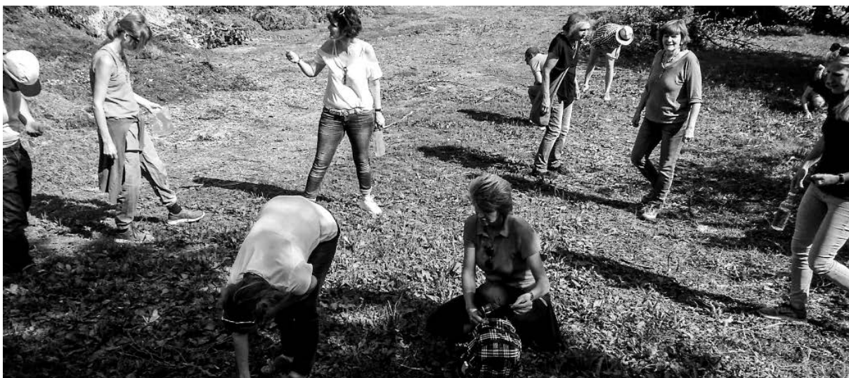
Teamtag – 14 Uhr – Kräutersuche unter kundiger Anleitung

Unter kundiger Leitung fand am 10. September eine Wildkräuterführung auf der Breite statt. Mit Plastiksäckli ausgestattet durchstreiften wir Feld, Wiesen und Wald und staunten, was die Natur alles zu bieten hat. So sammelten wir alle begeistert die (Un-)Kräuter ein und zupften an langen Tischen das Grünzeug und die Blüten zu einem Kräutermix, den man z.B. über Salate verteilen kann. Mit Wanderung, Apéro und Grill haben wir den Teamtag beschlossen. Für mich