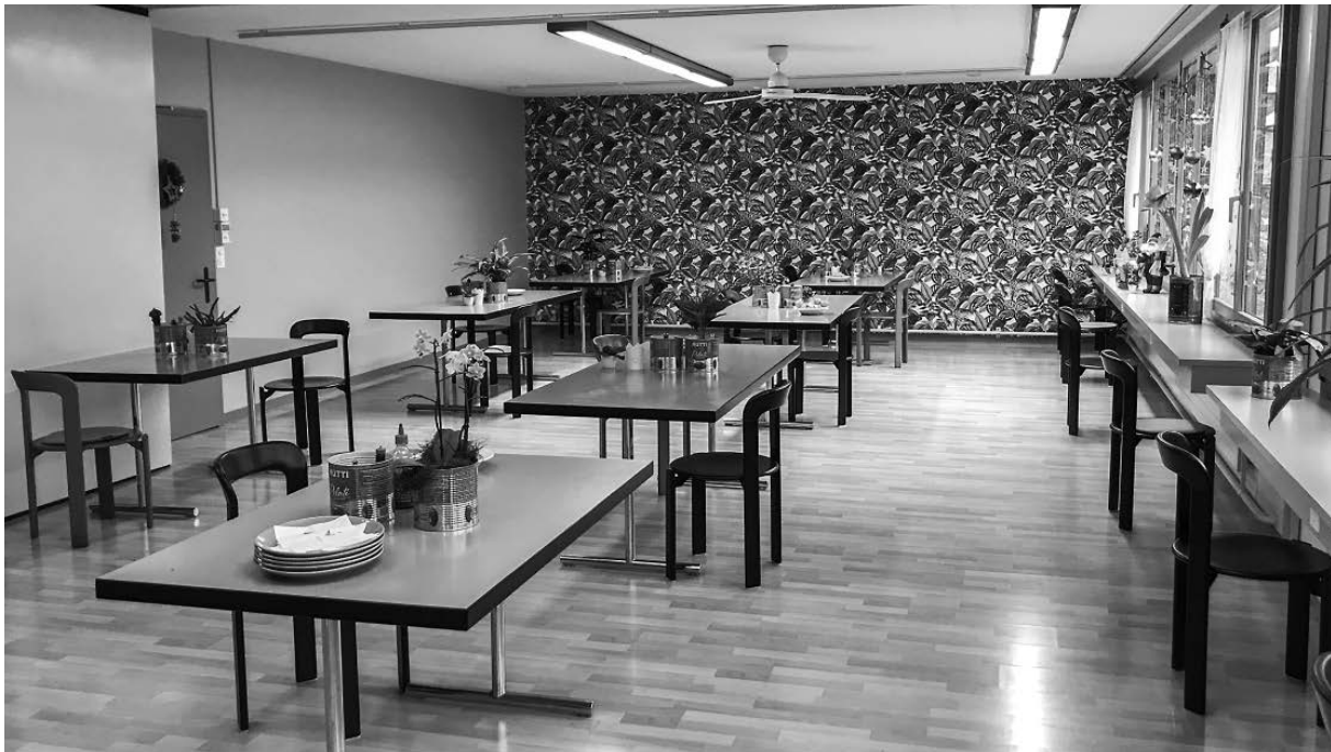
Saal-Renovation Herbst/Winter 2020, finanziert von einer nicht genannt sein wollenden Stiftung, und die Stühle von SH Power.

derin möchte gerne 120 Tafeln Raguaschokolade spenden, die sie nicht mehr verkaufen können. Da ich sie abholen müsste, muss ich leider ausschlagen, aber ich gebe ihr die Nummer der Restessbar von Schaffhausen. Die freuen sich bestimmt über eine süsse Abwechslung. So, jetzt aber Endspurt! Am Herd die Linsen- Tätschli nun ausbraten, das Gemüse im Ofen kontrollieren, den Dip abschmecken, Suppe umfüllen und daneben Abwasch machen und die letzten Servicevorbereitungen anweisen. Aber im heutigen eingespielten Team läuft alles wie am Schnürchen.