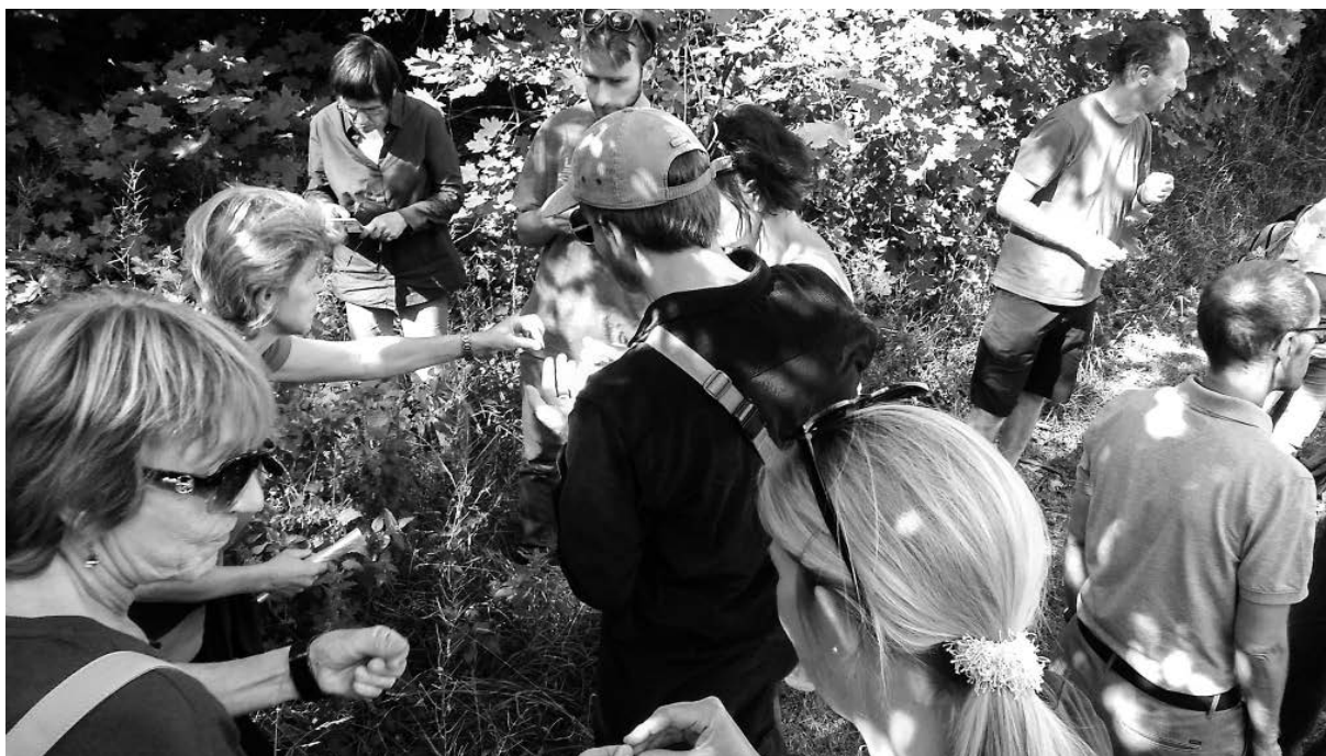
Teamtage – 14.30 Uhr – Wir bestaunen, was wir alles gefunden haben