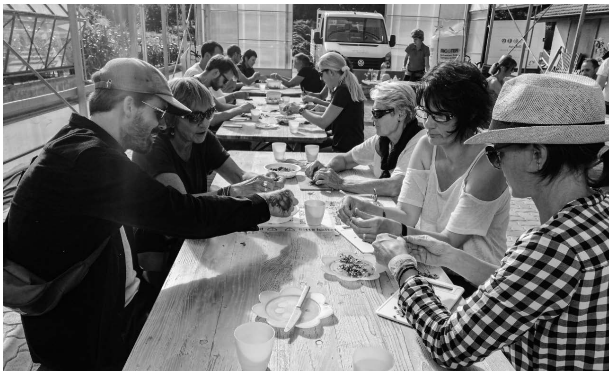
Teamtag – 15.30 Uhr – In Säckli abfüllen: Alle bekommen eine Portion frische Salatkräuter