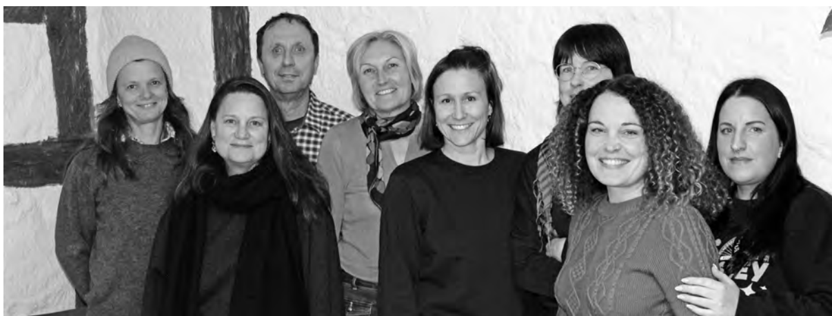
Vorstand mit Betriebsleitungen