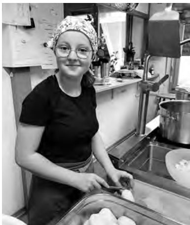
Zukunftstag in der Gassenküche

Wir fragen selbstverständlich nach der Motivation des Besuches der Gassenküche. Sind sie am richtigen Ort bei uns? Wie kamen sie auf uns? Das ist nicht immer einfach für die Menschen, denn der Schritt, hierherzukommen, war oft schon eine riesige Herausforderung. Manchmal sind es nur Überbrückungen in schwierigen Lebensphasen oder eine Verschnaufpause vom «mühsamen» Leben. Aber es ist nicht einfach für die Köchinnen: Wann und wie fragen wir nach, ohne jemanden vor den Kopf zu stoßen oder ihm zu nahe zu treten und somit zu verschrecken?